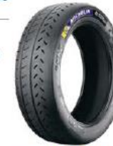
19/63-17 Pilot Sport R P01

Pour Asphalte humide et séchant. S'adaptent à une profondeur d'eau importante après retaillage.