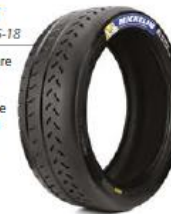
20/65-18 Pilot Sport R 33

Grâce à une meilleure mise en régime, ce pneu apporte un gain en performance chronométrique, en particulier dans les conditions les plus chaudes.