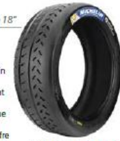
20/65-18 Pilot Sport R 33

Sculpture mixte avec un taux d'entailement, conforme à la réglementation FIA. Le pneu offre une meilleure prise en main de la voiture et absorbe plus facilement les bosses permettant de maintenir le maximum de contact au sol. Profil asymétrique qui maximise la motricité et le freinage. La partie extérieure offre une pression de contact optimale en virage.