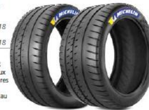
24/65-18 Pilot Sport R 11 29/65-18 Pilot Sport R 21

Déclinaison de la gamme Pilot Sport R aux dimensions et aux spécificités des voitures de la catégorie GT. Sculpture conforme au règlement FIA.