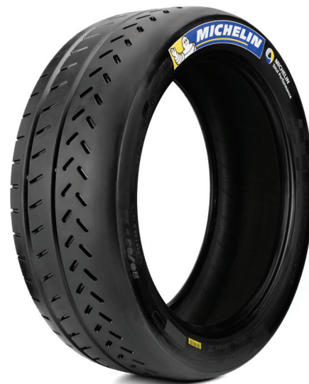
20/65-18 MICHELIN PILOT SPORT R 33

Les caractéristiques de ce nouveau produit permettent de garantir toujours plus de performance, une mise en régime plus rapide et un grip plus agressif.